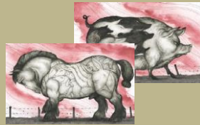
1. / Rebelión en la granja. George Orwell. 1945 (Centro Cultural Pablo Neruda)

Hemos propuesto a diez ilustradoras e ilustradores del estado español crear dos imágenes para uno de estos diez clásicos de la literatura universal.