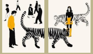
8. / El tigre de Tracy. William Saroyan. 1951 Ilustra: Elisa Arguilé (La Serrería)