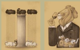
2. / La oveja negra y demás fábulas. Augusto Monterroso. 1969 Ilustra: Alberto Gamñón (Centro Cívico)