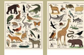
6. / Vida privada y pública de los animales. J. J. Grandville. 1868 Ilustra: Luci Gutiérrez (Residencia de la Tercera Edad)