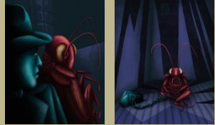
9. / La metamorfosis. Franz Kafka. 1915 Ilustra: Diego Fermín (La Abadía, Barrio La Peña)