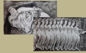
4. / La vida de las termitas. Maurice Maeterlinck. 1927 Ilustra: Javier Sáez Castán (Muralla Rambla San Pedro)