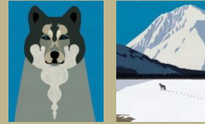
5. / Colmillo Blanco. Jack London. 190 Ilustra: Riki Blanco (Oficina de Turismo)