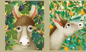
7. / Platero y yo. Juan Ramón Jiménez. 1914 Ilustra: Aitana Carrasco (Patio del Colegio Público)