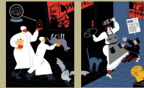
3. / Corazón de perro. Mijail Bulgakov. 1925 Ilustra: Arnal Ballester (Iglesia de San Pedro)